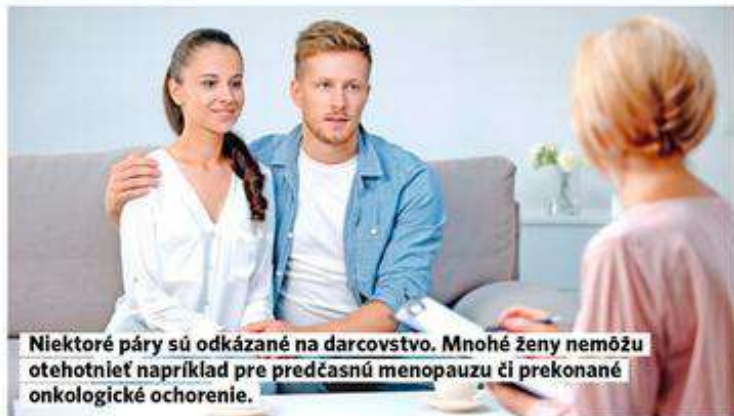
Niektoré páry sú odkázané na darcovstvo. Mnohé ženy nemôžu otehotnieť napríklad pre predčasnú menopauzu či prekonané onkologické ochorenie.

V takomto prípade má potenciálna dárkyňa aspoň k dispozícii veľmi podrobnú správu o svojom zdravotnom stave, o svojej ovariálnej rezerve.