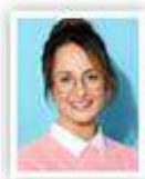
Pripravila redaktorka Soňa Sedláčková

Lucka by rada vedela, koľko detičiek sa podarilo z tejto jej dobročinnnej aktivity priviesť na svet, ale na Slovensku je darcovstvo prísne anonymné, dárkyňa sa nikdy nedozvie, komu boli jej oocyty poskytnuté. „Nemusím vedieť, kde žijú, ako vyzerajú alebo ako