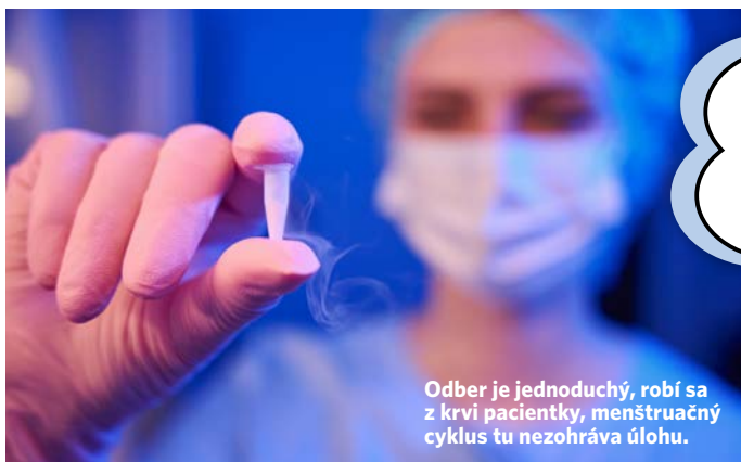
Odber je jednoduchý, robí sa z krvi pacientky, menštruačný cyklus tu nezohráva úlohu.

– Gynekológ dokáže z jedného odberu krvi povedať, ako je na tom