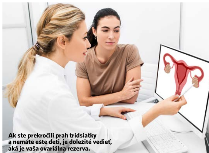
Ak ste prekročili prah tridsiatky a nemáte ešte deti, je dôležité vedieť, aká je vaša ovariálna rezerva.